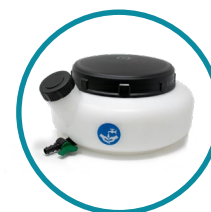
CISTERNA LAVAMANI 7lt