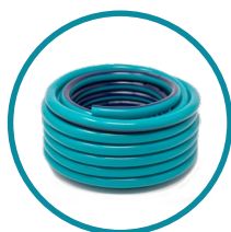
TUBO ACQUA ALTA PRESSIONE - 100 mt